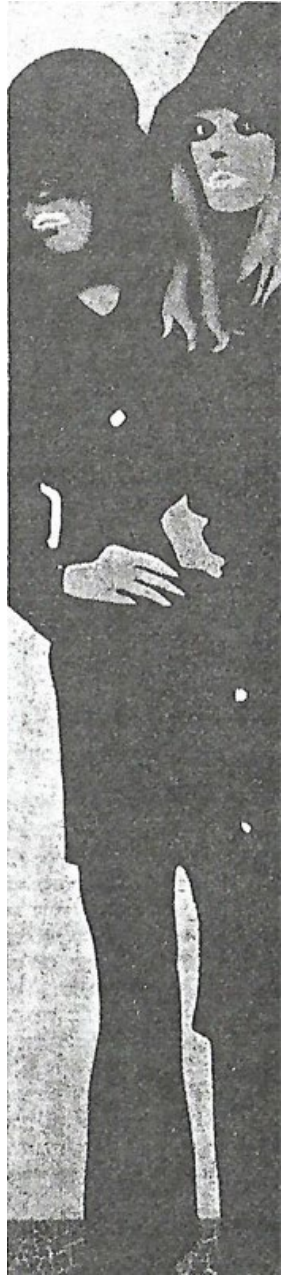
של סוף שנות השישים